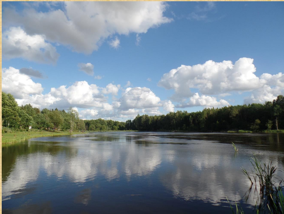
Łabędzi Staw w Obliwicach.