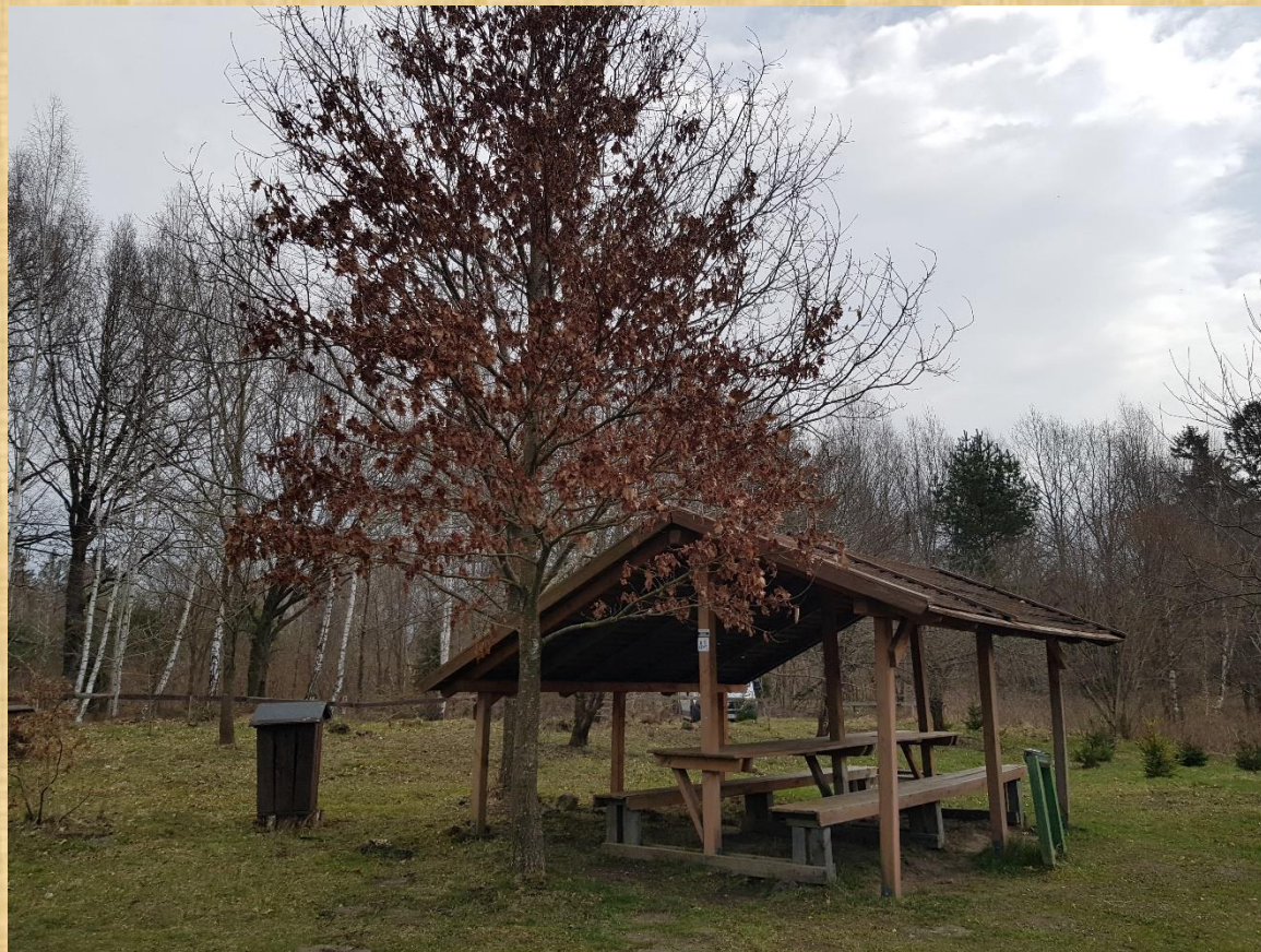
Łabędzi Staw w Obliwicach.