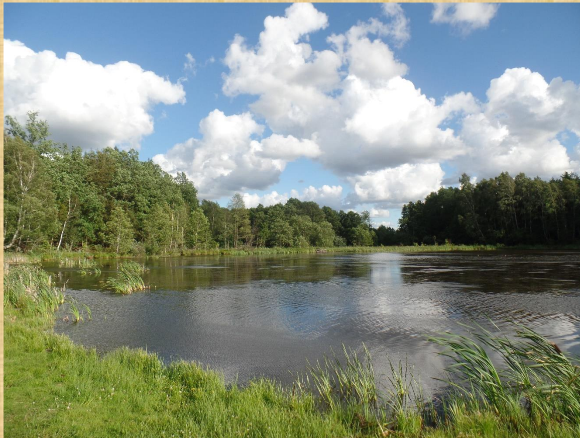
Łabędzi Staw w Obliwicach.