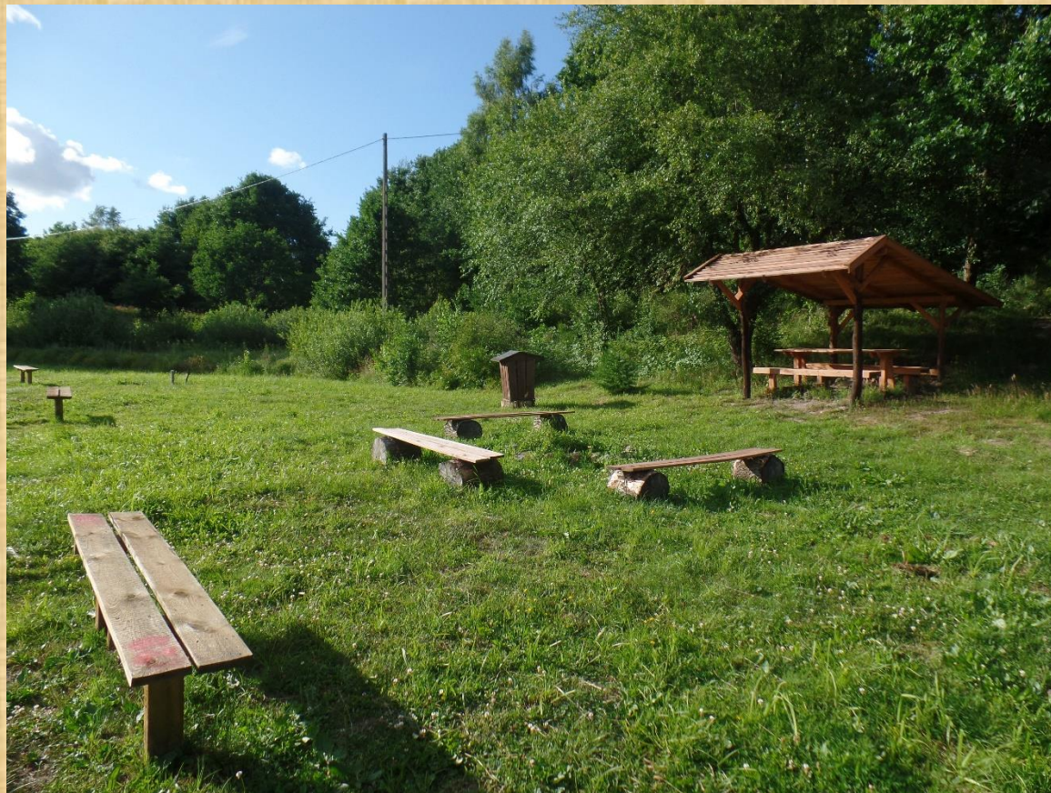
Łabędzi Staw w Obliwicach.