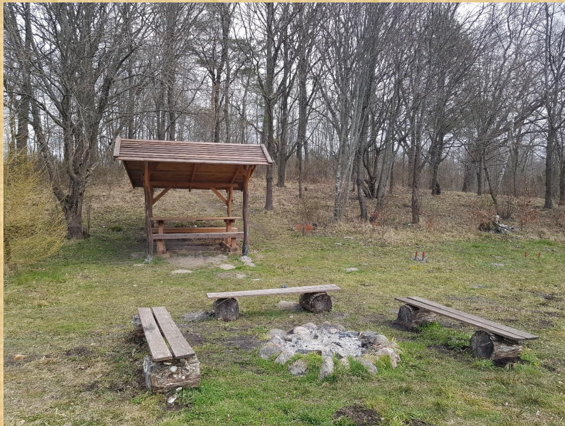
Łabędzi Staw w Obliwicach.