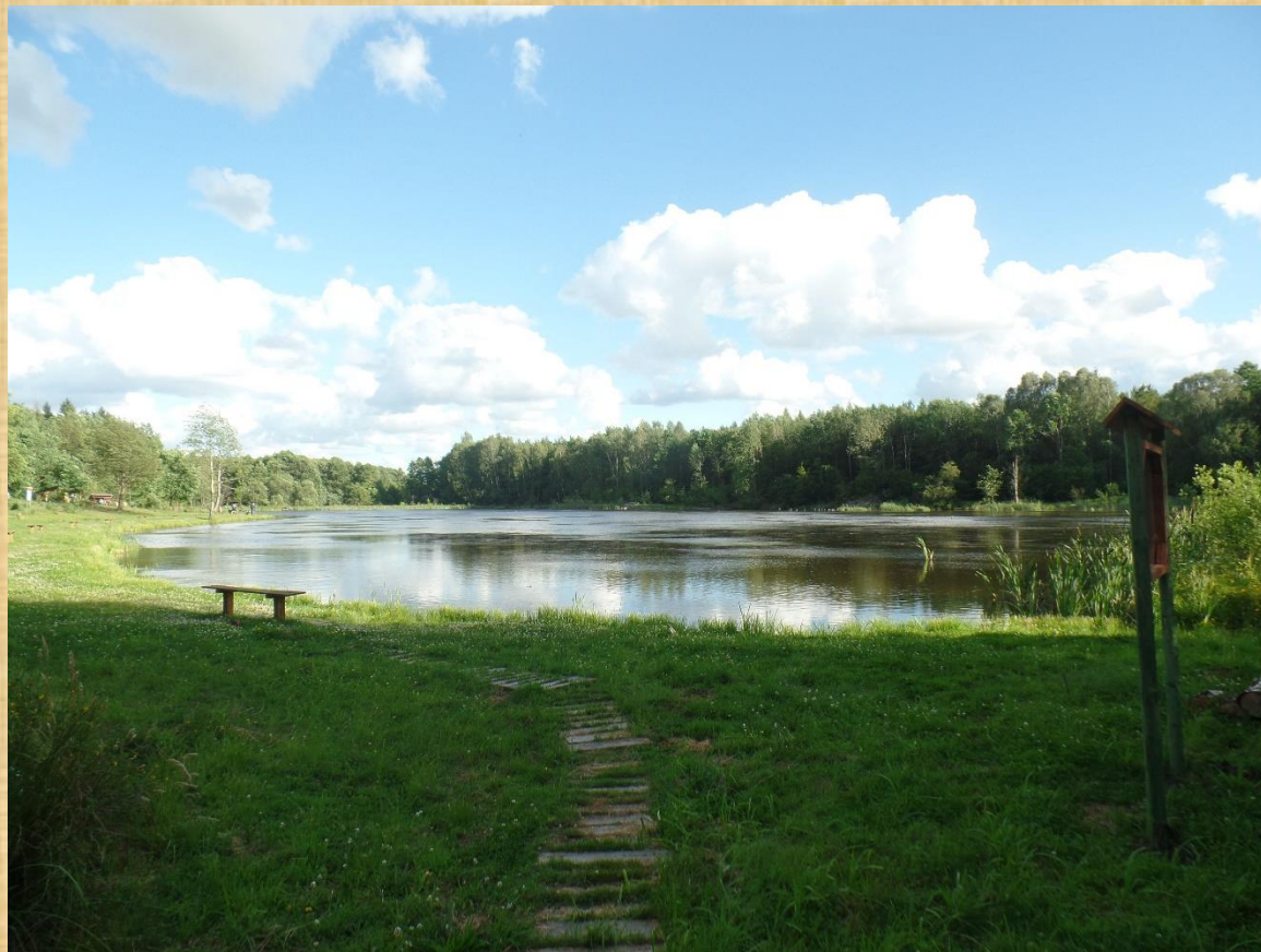
Łabędzi Staw w Obliwicach.