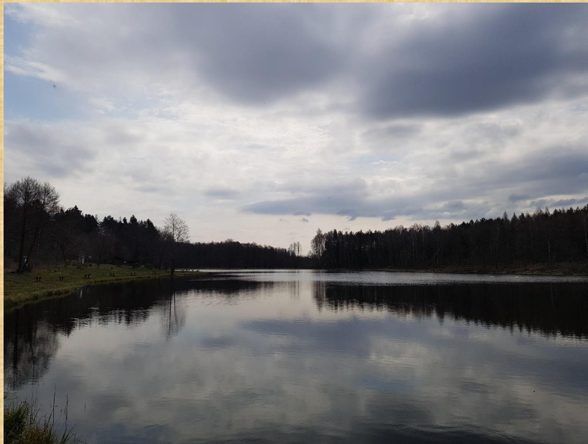
Łabędzi Staw w Obliwicach.