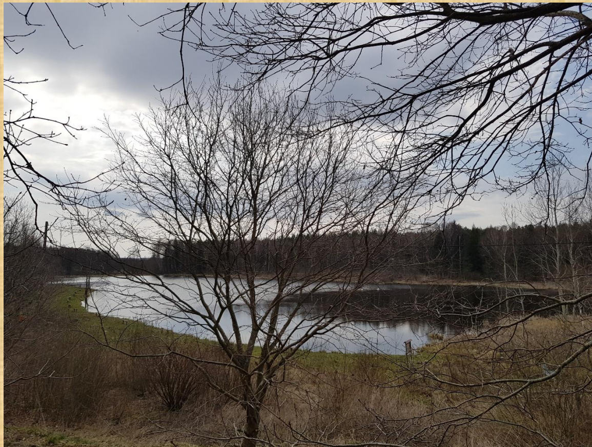
Łabędzi Staw w Obliwicach.